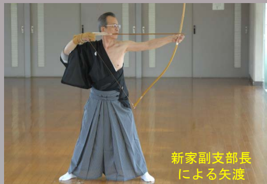
新家副支部長 による矢渡